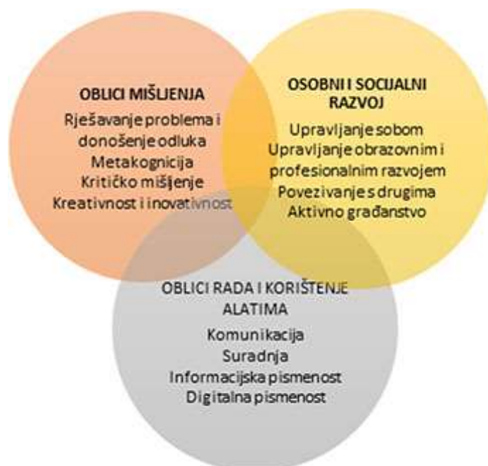
3. slika: Grafički prikaz temeljnih kompetencija