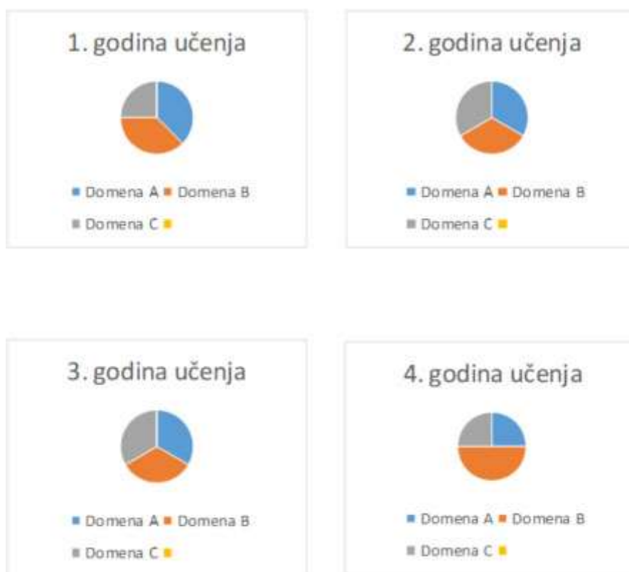
1. slika: Model strukture predmeta TK i odnos domena u četiri godine učenja i poučavanja.

U nastavnome predmetu Tehnička kultura učenici usvajaju i primjenjuju znanja, razvijaju vještine, stavove, odgovornost i samostalnost vezane uz opću tehničku kulturu, a time i opću kulturu. Upoznaju različita područja tehnike poput prometa, graditeljstva, strojarstva, elektrotehnike i drugih koja su svojim dostignućima utjecala na nebrojene promjene uvjeta i kvalitete života čovjeka kao pojedinca, na promjene u društvu i u širem prirodnomu okruženju. Stjecanje opće tehničke kulture, tj. tehničke pismenosti, ostvaruje se usvajanjem određenih znanja o tehničkim tvorevinama, koje nas okružuju, dobiti, koju donose, načinu rada i mogućim opasnostima. Razvijanje vještina omogućuje kreativnost i inovativnost u dizajniranju i izradi tehničkih tvorevina te sigurno korištenje i pravilno održavanje tehničkih tvorevina kao i kritički odnos koji uključuje razmatranje širega konteksta tehnike i njezina utjecaja s ekološkoga, ekonomskoga, kulturološkoga i sociološkoga aspekta. Cjelovitim sagledavanjem tehnike u osnovnoškolskome obrazovanju postiže se njezina relevantnost za sve učenike neovisno o specifičnim interesima i odabiru budućega zanimanja. Štoviše, omogućuje se razvoj učenika u odgovornoga mladoga građanina koji će u budućnosti moći kritički sagledavati svoj uži i širi tehnički okoliš i biti spremniji za donošenje kvalitetnih odluka.