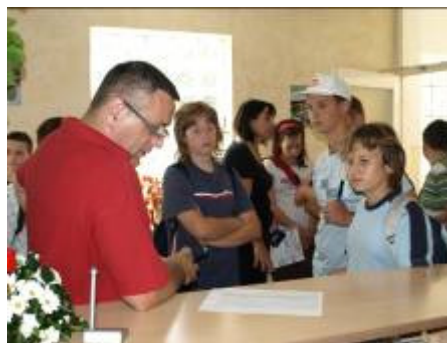
Razmještaj po sobama na recepciji hotela.