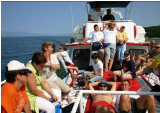
Idemo na izlet brodom u Njivice.