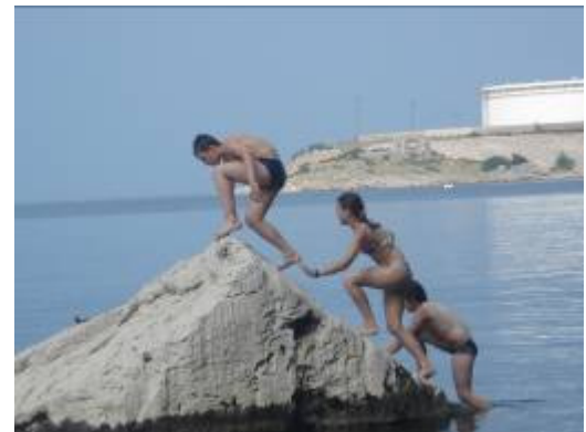
Na kupanju je uvijek veselo