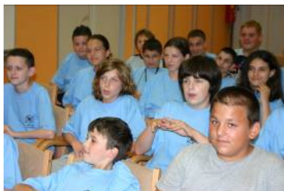
Dio polaznika pozorno sluša izlaganje.