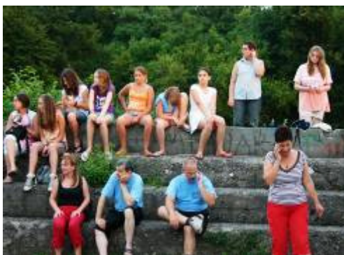
Na sportskim susretima igrače je bodrila brojna publika.