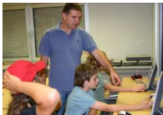
Na satu programiranja.