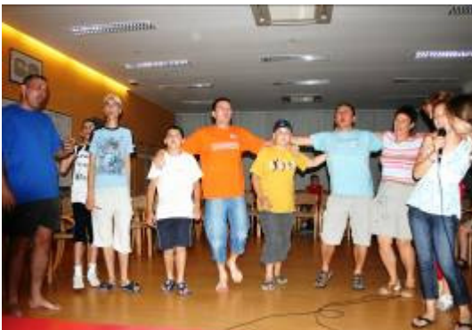
Karaoke, karaoke, karaoke... veselo i raspjevano.