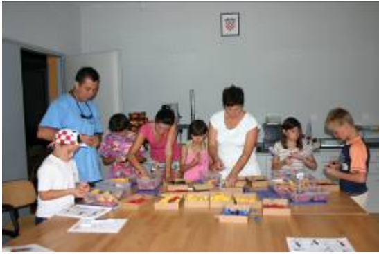
Još nekoliko detalja iz brojnih radionica – polaznici i predavači.