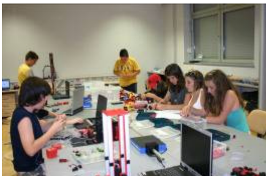
U radionicama je bilo uvijek živo i zanimljivo.