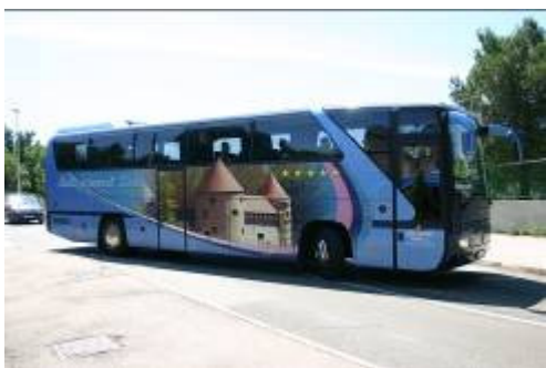
Većina polaznika škole stigla je turističkim autobusom.