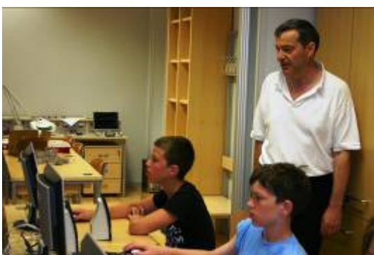
Na satu elektronike.