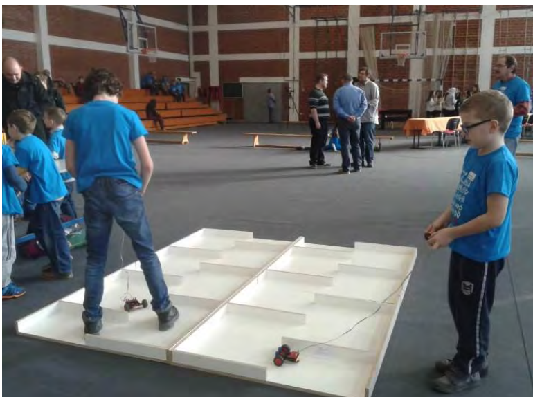
Paralelna vožnja robotskih kolica.

U sklopu Robokupa održava se i natjecanje iz paralelne vožnje robotskih kolica namijenjeno malim robotičarima iz dječjih vrtića i nižih razreda osnovne škole. Spretnost i vještinu u paralelnoj vožnji robotskih kolica odmjerilo je trinaestero djece iz dječjeg vrtića Zvončić iz Zagreba. U kategoriji nižih razreda osnovnih škola u paralelnoj vožnji sudjelovalo je desetoro djece, šestoro iz OŠ Julija Klovića, dvoje iz OŠ Jure Kaštelana iz Zagreba, te dvoje iz OŠ Eugena Kvaternika iz Velike Gorice.